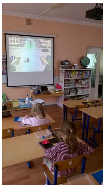
Рис.2.Аппликация «Дорожные знаки»

Свои полученные знания они передают на занятиях по изобразительной деятельности: рисование, аппликация (см. рис.2,3).